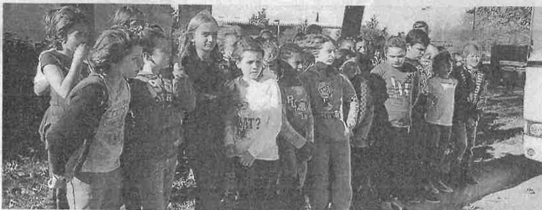
Les élèves de l'école de l'Est ont également participé.